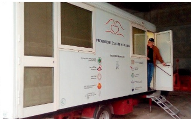
Controlli e prevenzione per i lavoratori delle aziende coinvolte nel progetto

interno diverse visite mirate alla prevenzione di importanti patologie (visita senologica, cardiologica, dermatologica, controllo dell'udito e della vista). All'inizio di ottobre, inoltre, è stata lanciata la campagna Nastro Rosa 'Ppg thinks in pink', con visite mirate alla prevenzione di due importanti patologie femminili - il cancro dell'utero e del seno - e a novembre saranno offerti ai dipendenti uomini accertamenti legati al controllo della prostata. Infine, il Gruppo Roquette, in collaborazione con la Lilt, ha realizzato una campagna di prevenzione in favore delle proprie collaboratrici, oltre a una visita prelimi-